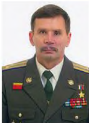
БОЧАРОВ ВЯЧЕСЛАВ АЛЕКСЕЕВИЧ Герой Российской Федерации Президент Фонда «Солдаты XXI века против войн» Член Общественной палаты РФ