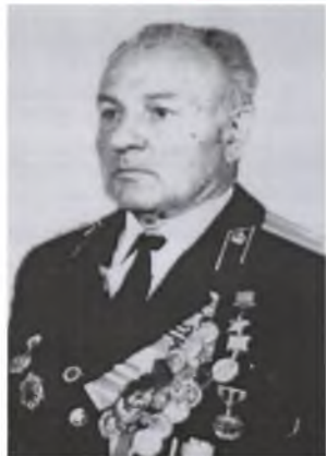
КАЧАЛКО ИВАН ЕЛИЗАРОВИЧ Участник Великой Отечественной войны Герой Советского Союза Умер в 2010 г.