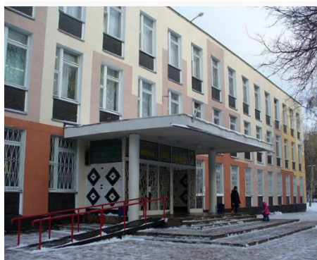
УК № 1 – 1-2 классы

В 2018 г. завершился процесс построения модели «Школа ступеней», что означает создание единой образовательной среды для одной возрастной категории