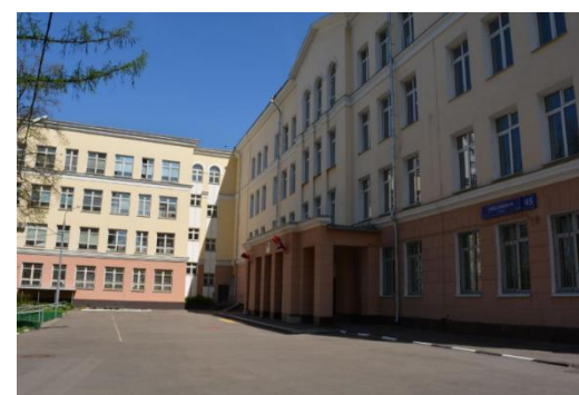
УК № 4 – 5-7 классы