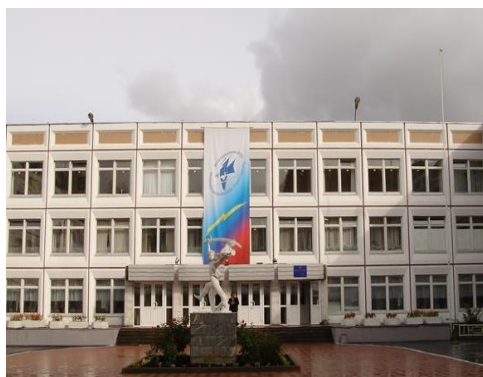
УК № 2 – 8-11 классы