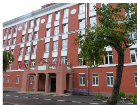
УК № 3 – 3-4 классы